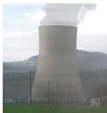
La centrale nucléaire de Gösgen: correspond-elle aux normes de sécurité?

Il nous incombe de montrer dès maintenant qu'un futur sans énergie nucléaire et une autonomie énergétique sont envisageables. Il faut se donner les moyens d'y parvenir. Finalement, les responsables politiques doivent inciter à une diminution de la consommation d'énergie et promouvoir les énergies renouvelables. En tant que petit pays indépendant, nous devons reconnaître les signes des temps et faire bon usage de nos forces.